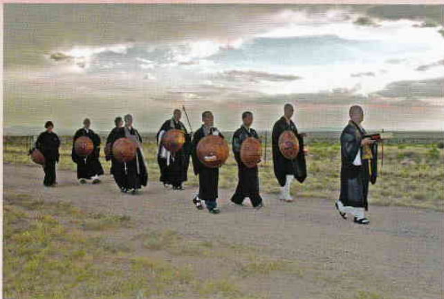
大本山永平寺大田監院老師を先頭に原爆の火を ささげながら平和行進中の僧侶たち

自分にとつてのモチベーション が何かを知り、それをコント ロールし、バランスを取り合っ